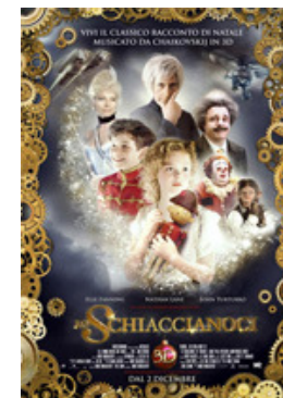
LO SCHIACCIANOCI (107 minuti)

Vienna, anni Venti. Mary ha nove anni, un fratello più piccolo che non la lascia in pace e una vivida fantasia. La vigilia di Natale, i genitori lasciano i due bambini con l'amato zio Albert, che fa dono a Mary di uno schiaccianoci di legno, N.C. Con la complicità della notte, il giocattolo si anima e conduce Mary in una dimensione parallela e meravigliosa. Qui la bimba apprende che N.C. in realtà è un principe, ridotto a pezzo di legno dal sortilegio della subdola madre del Re dei Ratti, il cui piano criminale prevede il rogo di tutti i giocattoli e la "rattificazione" del mondo.