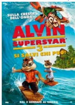
ALVIN SUPERSTAR 3 - SI SALVI CHI PUO'! (87 minuti)

L'isola dei famosi in salsa squeak'n'roll