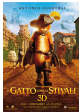
IL GATTO CON GLI STIVALI (90 minuti)

Storia del personaggio più amato della saga di Shrek