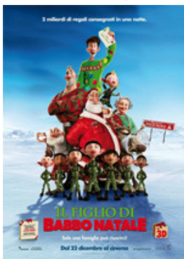
IL FIGLIO DI BABBO NATALE (98 minuti)

Come può Babbo Natale fare il giro del mondo in una notte?